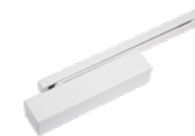
DORMA TS93 BASIC - obenliegend mit Gleitschiene