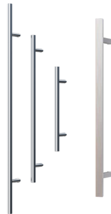
Knauf P45: Ø 30 L=580mm Ø 40 L=1200mm Ø 40 L=1800mm