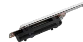
DORMA ITS96 - verdeckt