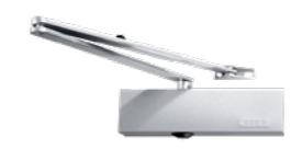
GEZE TS2000 - obenliegend mit Gestänge